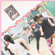
マールアーツエクササイズ