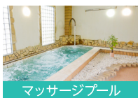
マッサージプール