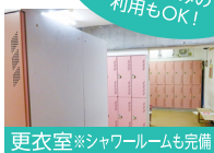
更衣室※シャワールームも完備